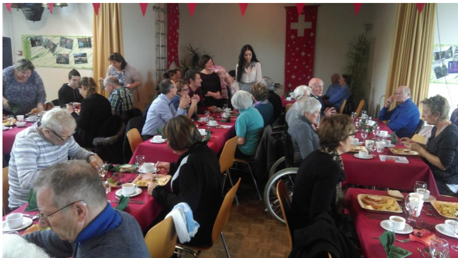
Brunch à Jeuss, 30 octobre 2016.

Pour plus d'informations : http://journee-proches-aidants.ch/