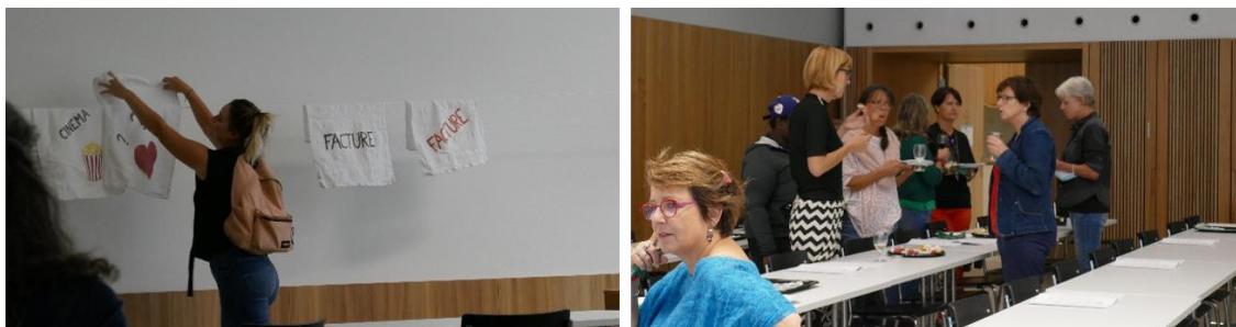
Représentation théâtrale à l'occasion de l'Assemblée générale de PA-F du 7 septembre 2020