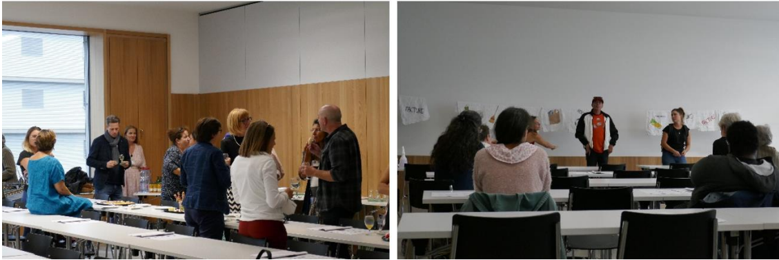
Theatervorstellung an der Generalversammlung von PA-F am 7. September 2020